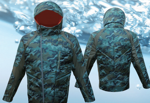
メンズ・長袖タイプ