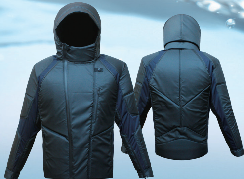
メンズ・長袖タイプ