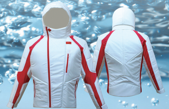
レディース・長袖タイプ