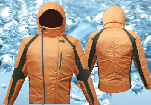
レディース・長袖タイプ